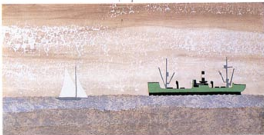
Petroliera, 1960, tecnica mista su cartoncino, cm. 26x50 collezione privata, Castelnuovo di Porto, Roma