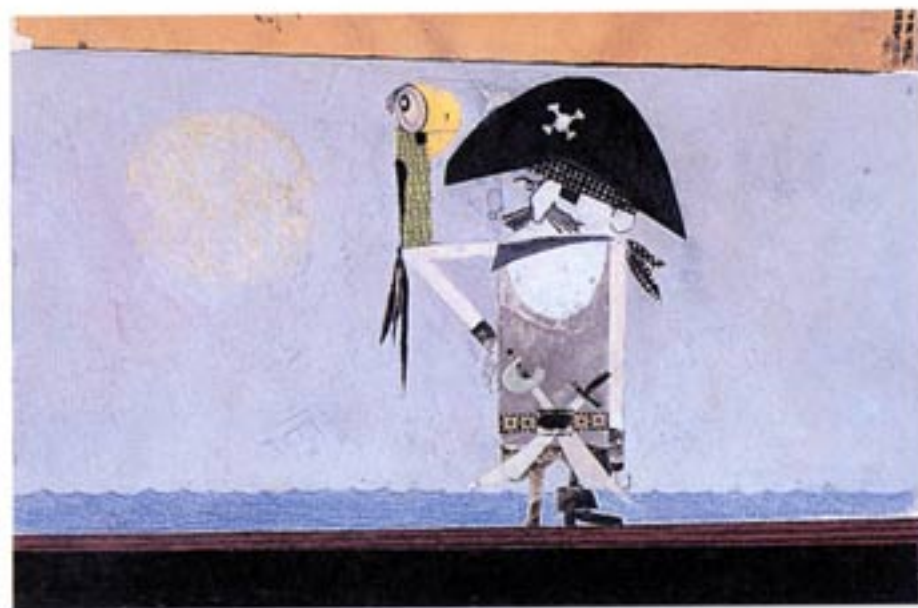
Pirata, 1963, tecnica mista su cartoncino, cm. 25x35 collezione privata, Castelnuovo di Porto, Roma